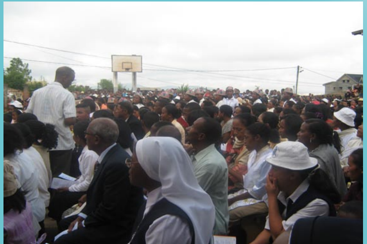
Le grand jour avec les chrétiens