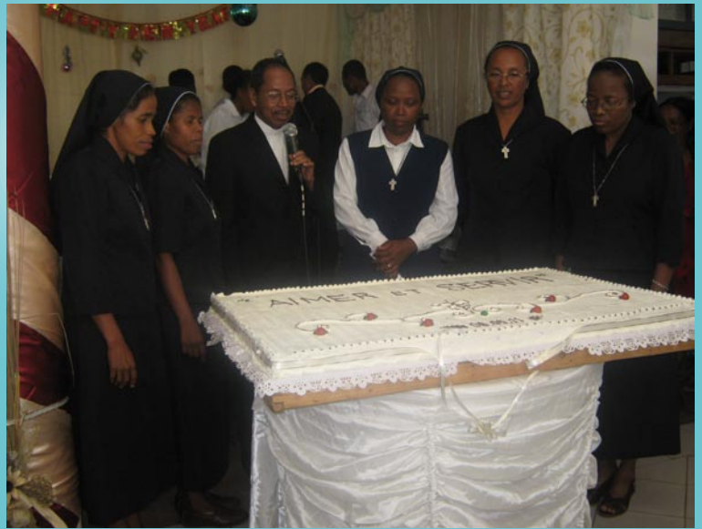
Le partage de gateaux avec Mgr Fulgence RABEMAHAFALY

Tout sera pour la gloire de Dieu et le réparation