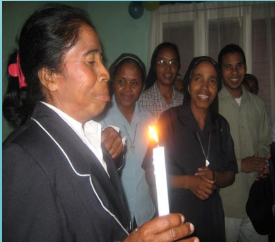
La veille au soir avec la famille