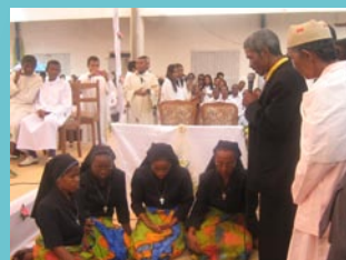
Bénédition de la famille

Nous rendons grâce à Dieu pour ses merveilles et son amour immense, parce que nous avons bien senti que cette fête était bien passée grâce à Lui et aussi la collaboration de chacun dans la région: les sœurs et les associés. Tout sera pour la gloire de Dieu et la Réparation.