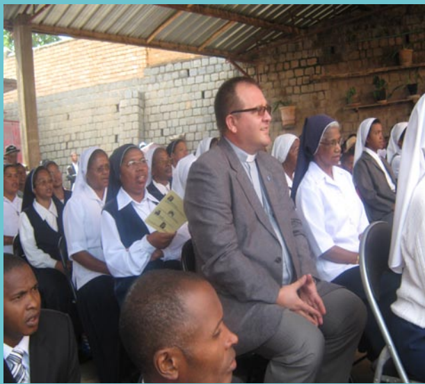
La famille SMR avec les invités